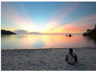
Koh Phangan 📍