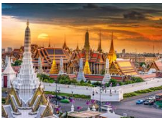
Koh Phangan 📍