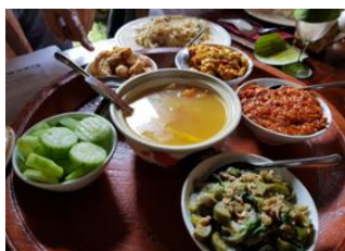
Chiang Mai 📍