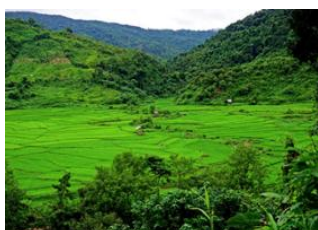
Luang Namtha 📍