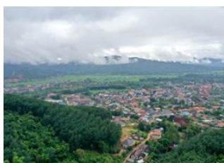
Luang Namtha 📍