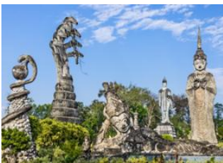
📍 📍 Nong Khai 📍