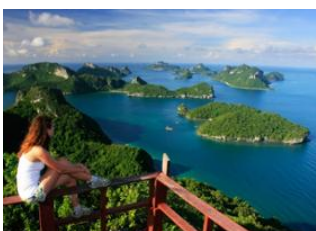
Koh Phangan 📍