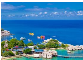
Koh Phangan 📍