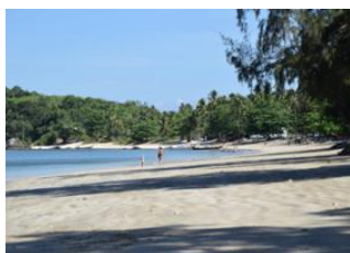
Parc National de Khao Sok 📍 🚗 160km - ⌚ 2h 30m Krabi 📍 🚗 25km - ⌚ 40m Koh Jum 📍