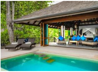
Koh Jum 📍