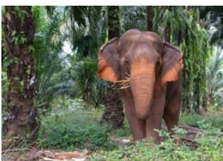
Chiang Mai 📍