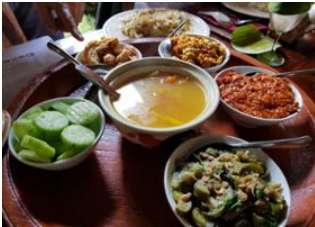
Chiang Mai 📍