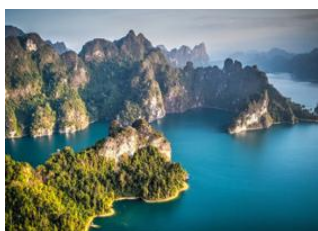
Parc National de Khao Sok 📍