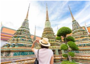
Koh Yao Yai 📍