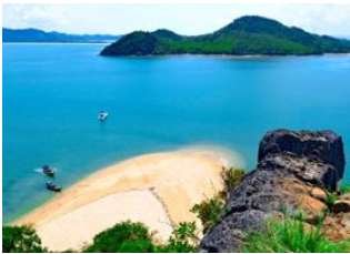
Koh Yao Yai 📍