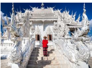
Bangkok - Aéroport de Don Muang 📍 ✈️ - 🕒 1h 25m Chiang Rai 📍