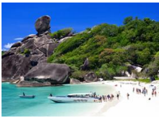
Khao Lak 📍