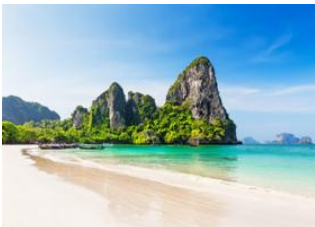
Ao Nang 📍