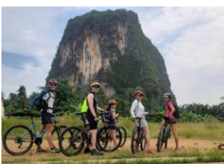
Ao Nang 📍