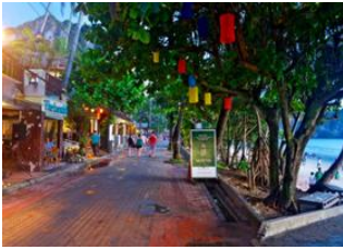
Parc National de Khao Sok 📍 🚗 160km - ⌚ 2h 30m Ao Nang 📍