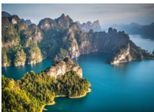
Parc National de Khao Sok 📍