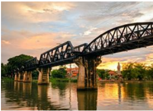
Amphawa 📍 🚗 100km - ⌚ 2h Kanchanaburi 📍