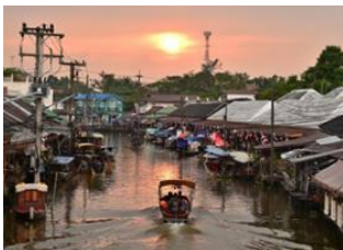
Bangkok - Aéroport de Suvarnabhumi 📍 🚗 100km - ⌚ 2h Amphawa 📍