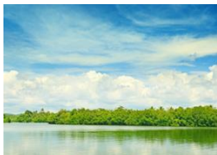
Amphawa 📍 🚗 100km - ⌚ 2h Kanchanaburi 📍