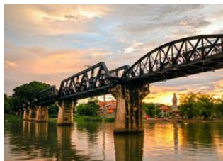
Amphawa 📍 🚗 100km - ⌚ 2h Kanchanaburi 📍