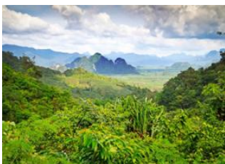
Parc National de Khao Sok