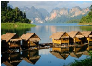
Parc National de Khao Sok