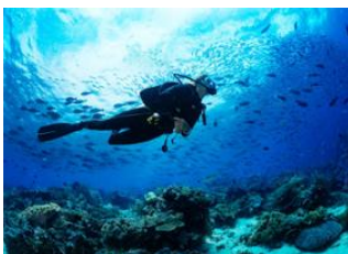
Khao Lak 📍